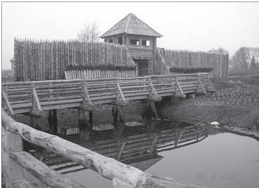
Fot. 3. Rekonstrukcja bramy wjazdowej z palisadą i mostem (M. Ziąbka)