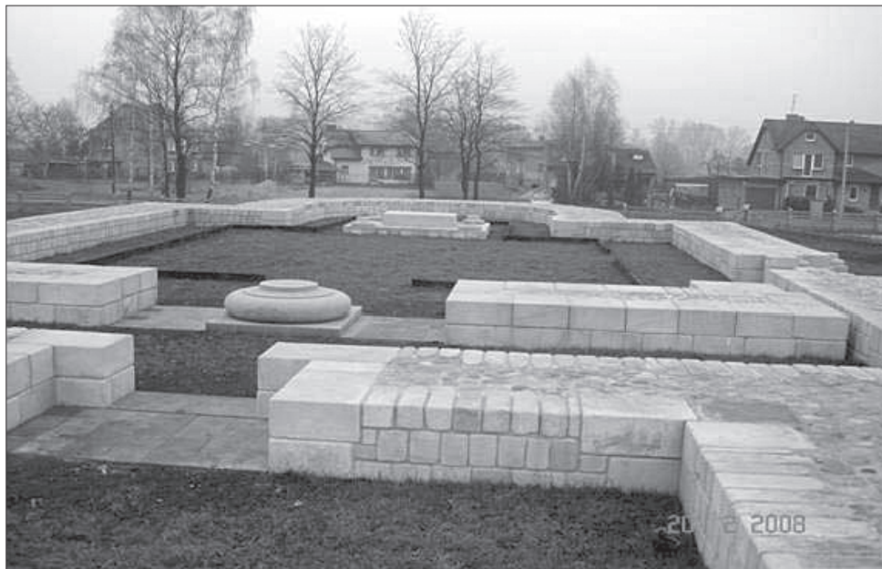
Fot. 1. Rekonstrukcja przyziemia fundamentów kolegiaty pod wezwaniem św. Pawła (M. Ziábka)