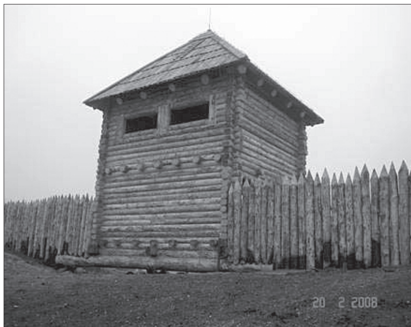
Fot. 2. Rekonstrukcja wieży obronnej na koronie wałów (M. Ziábka)