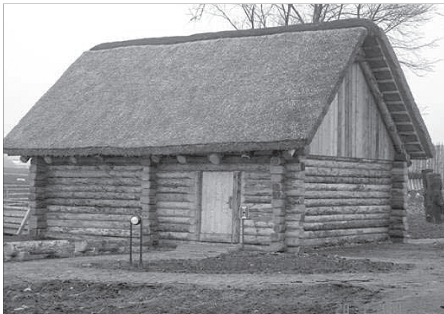
Fot. 4. Rekonstrukcja chaty średniowiecznej (M. Ziąbka)