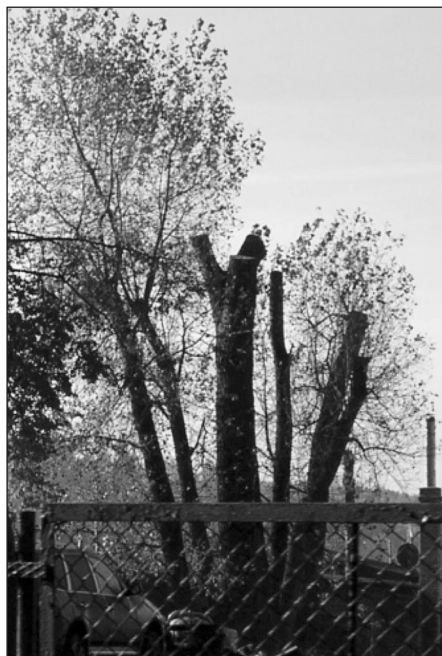
Rys. 1. Nadmiernie przycięte korony drzew nad Jeziorem Krzywym w Olsztynie